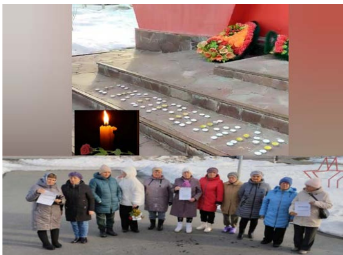
на фото волонтерские группы «Берегини»,

24 марта «серебряные» волонтеры из села Горьковка выразили свое единение вместе со всем народом России. Они возложили лампы, свечи, цветы и мягкие игрушки к памятнику «Вечная память героям», в знак скорби по жертвам ужасающего по своей жестокости террористического акта Крокус Сити Холл.