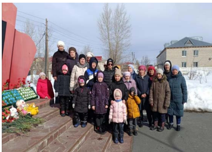
«Горьковка Вяжем Z», КАД «Любава» и совет ветеранов